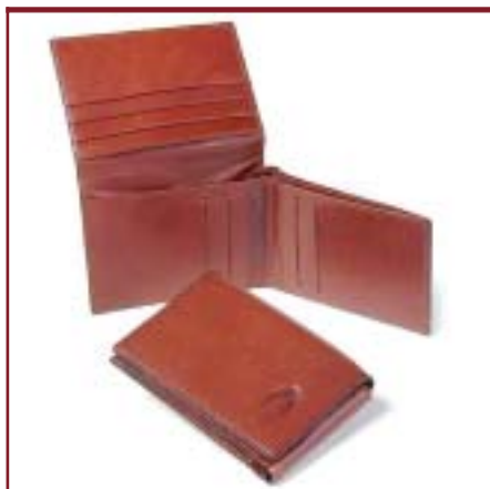
Art. 2085 Billetera de caballero.