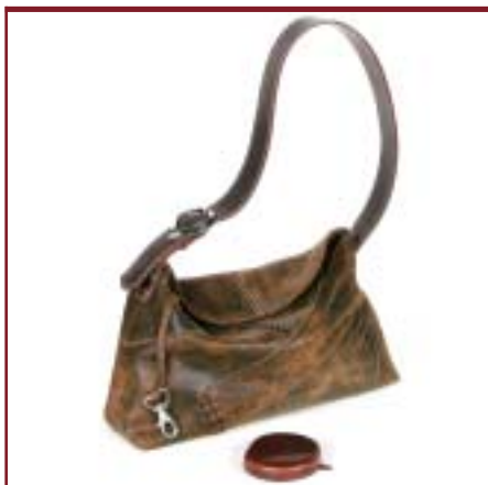
Art. 6800 Modelo Kiri.