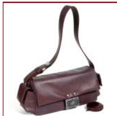
Art. 6812 Modelo Bomarea