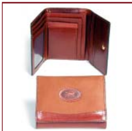
Art. LN2049 Billetera de dama. Nobuk y cuero.