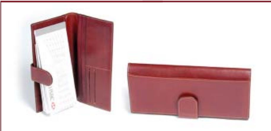
Art. L2091 Porta chequera