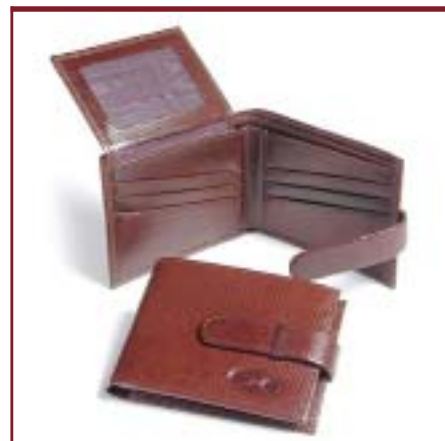
Art. 2078 Billetera de caballero.