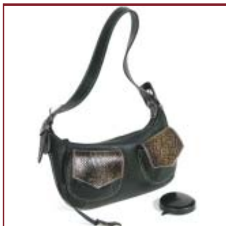
Art. 6804 Modelo Manuka.