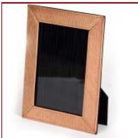
Portarretratos de cuero. Medida 9 x 13 cm.