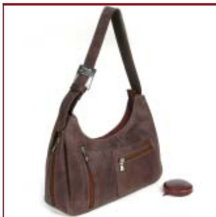
Art. 6811 Modelo Chimonanto