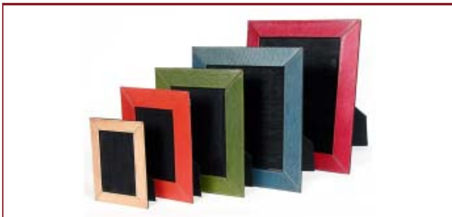
Art. 2350 Portarretratos de cuero.