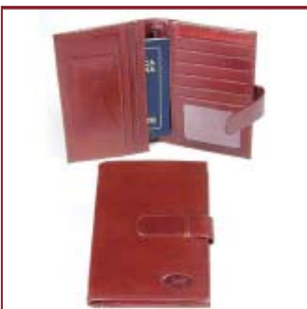
Art. L2072 Porta pasaporte de dama.