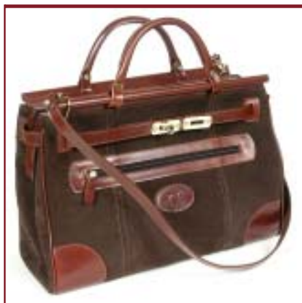
Art. 6550 Modelo Hermes.