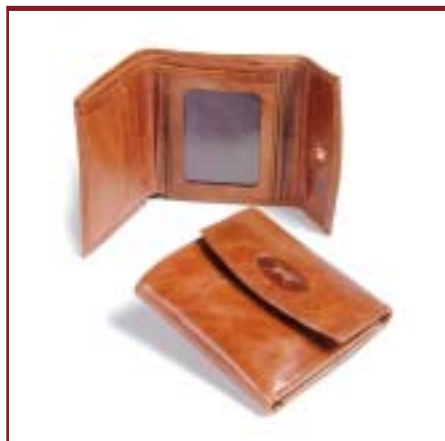
Art. 2040 Billetera de dama.