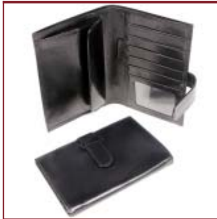
Art. 72-1 Porta pasaporte.