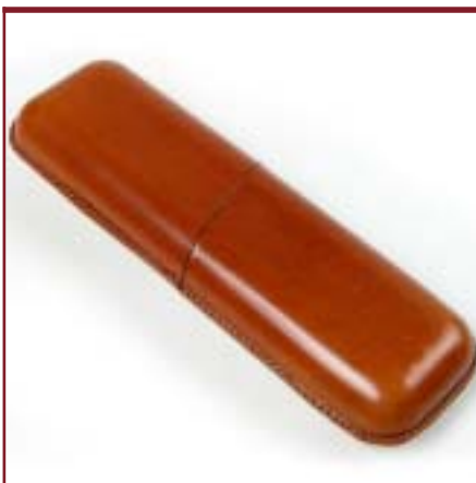
Art. 2302 Purera de cedro forrado en cuero con 2 cilindros.