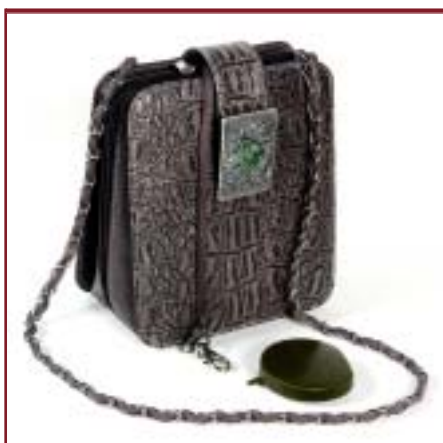
Art. 6807 Modelo Pasionaria

Medidas: 28 x 15 x 6 cm. 28 x 33 x 6 cm.