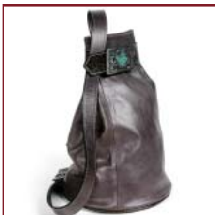
Art. 6808 Modelo Cósmos