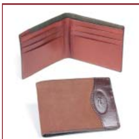
Art. LN3067 Billetera de caballero. Nobuk y cuero.