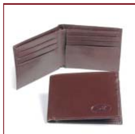
Art. L3053 Billetera de caballero tipo dolar.

Consultar variedad de colores materiales y combinaciones disponibles para cada artículo.