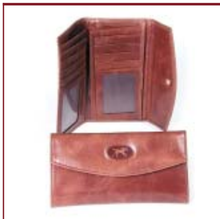
Art. 2085 Fichero de dama.