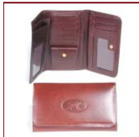
Art. 2078 Fichero de dama.