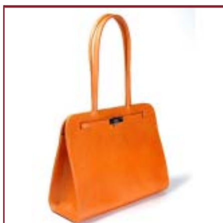
Art. 6541 Modelo Elegance