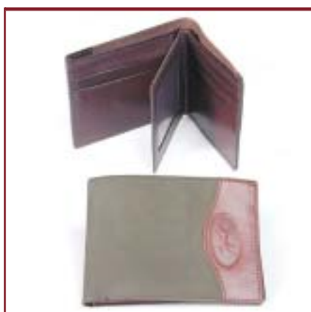
Art. LN3068 Billetera de caballero con volante. Nobuk y cuero.