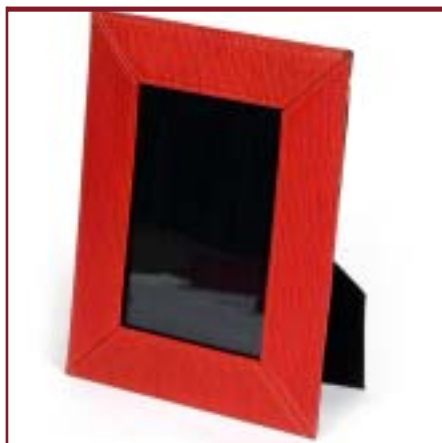
Portarretratos de cuero. Medida 10 x 15