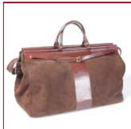
Art. Bolso de Palo