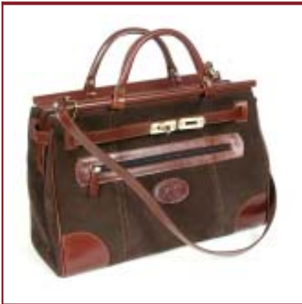
Art. 6550 Modelo Hermes.