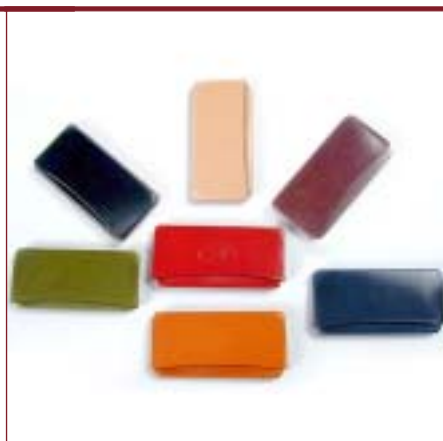
Art. 1300 Tarjetero horizontal.