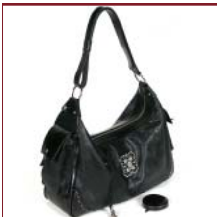
Art. 6803 Modelo Ojitos Negros.