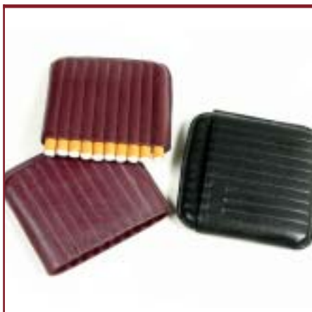
Pitillera Cigarrera de cuero.