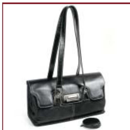
Art. 6809 Modelo Camará