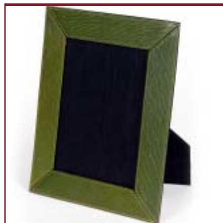
Portarretratos de cuero. Medida 13 x 18 cm.