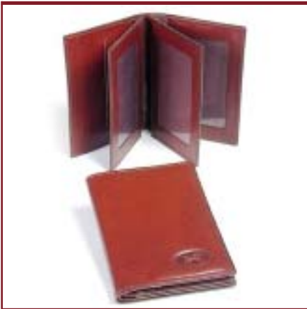
Art. L3133 Porta documentos con 2 volantes.