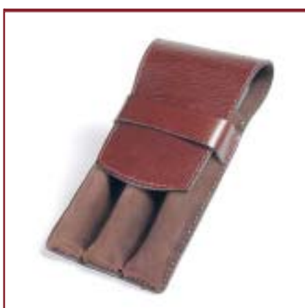
Art. 1138 Portalápices / lapiceras, con pasa cinturón y solapa.

Consultar variedad de colores materiales y combinaciones disponibles para cada artículo.