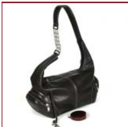
Art. 6801 Modelo Cattleya.