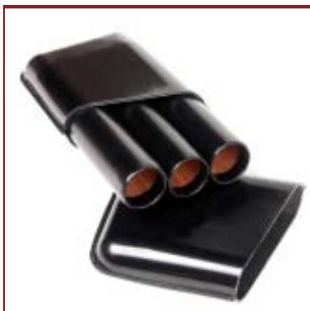
Art. 2303 Purera de cedro forrado en cuero con 3 cilindros.