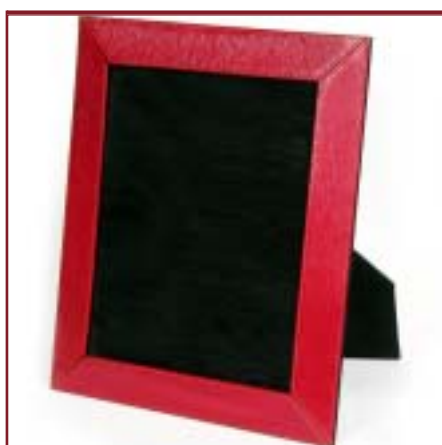
Portarretratos de cuero. Medida 20 x 25 cm.

Consultar variedad de colores materiales y combinaciones disponibles para cada artículo.