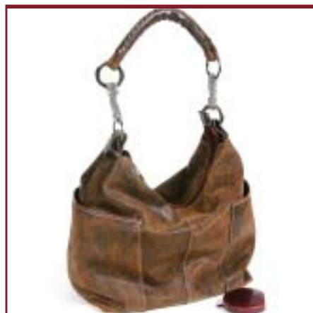
Art. 6805 / 6806 - Modelo Catalpa.

Medidas: 28 x 15 x 6 cm. 28 x 33 x 6 cm.