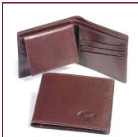
Art. 2040 Billetera de caballero.