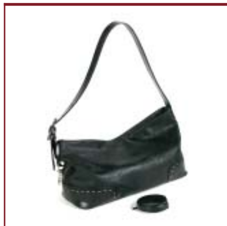
Art. 6802 Modelo Clivia.