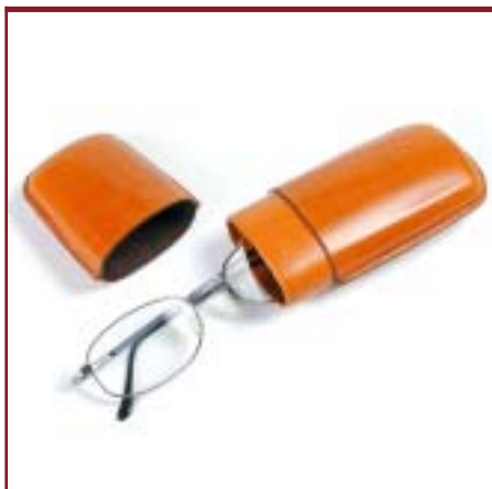
Art. 1201 Portaentes.