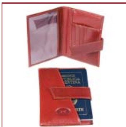
Art. L2071 Porta pasaporte de caballero.

Consultar variedad de colores materiales y combinaciones disponibles para cada artículo.