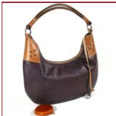
Art. 6810 Modelo Brezo