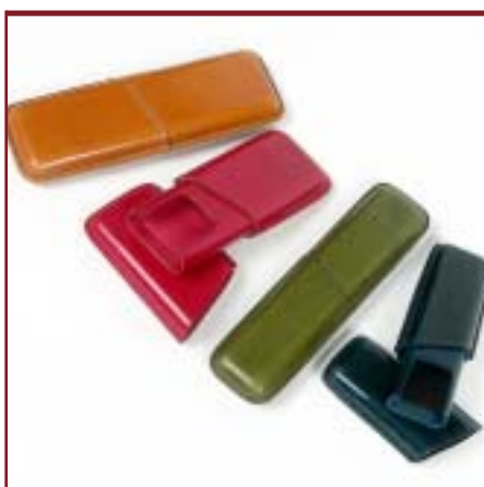
Art. 1137 Portalápices.