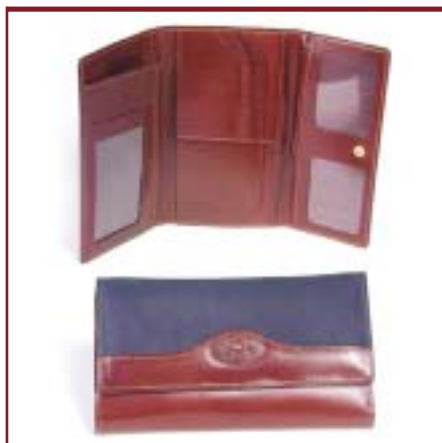
Art. 2083 Fichero de dama. Nobuk y cuero.