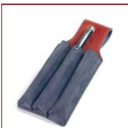
Art. 1138 Portalápices / lapiceras, con pasa cinturón.